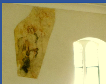
Fresque de Jésus-Christ face à l'entrée originelle