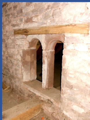
Fenêtre géminée occultée