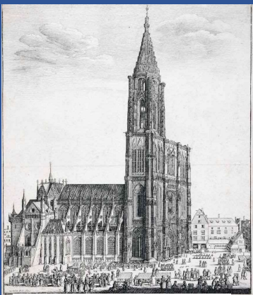
Cathédrale de Strasbourg