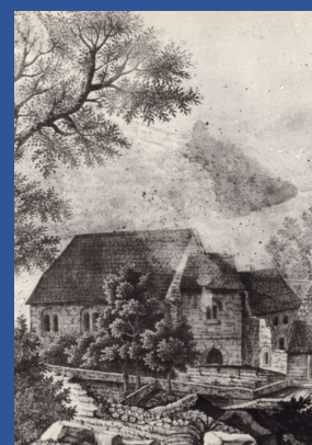
Lithographie de J. Guiaud