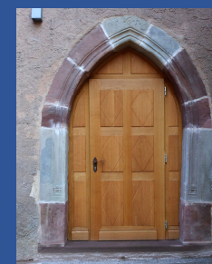
Porte de l'église