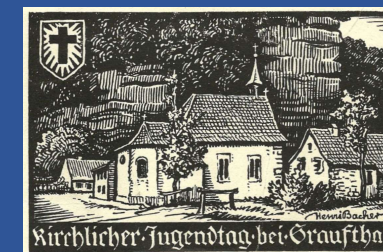
Carte postale d'Henri Bacher