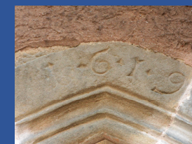
Linteau de la porte daté 1619

Cette église a traversé quatre siècles, en adaptant sa destinée aux différentes époques : église protestante, simultanée, luthérienne, lieu d'exposition d'art sacré plus récemment. En quatre cents ans, ce bâtiment a subi transformations, destructions, agrandissements, réparations pour nous présenter aujourd'hui ce visage. La chronologie de l'église de la Bienheureuse-Vierge Marie débute en 1551, par la sécularisation de l'abbaye de Graufthal qui a pour conséquence la ruine de ses bâtiments.